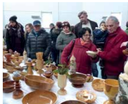
Im Veranstaltungssaal der Gemeinde wurden z.B. Holzelemente angeboten.