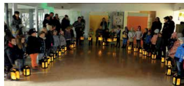
Die Kindergartenkinder aus Pilgersdorf starteten ihren Umzug im Schulgebäude (oben), die Kinder aus Bubendorf vor der Kirche mit ihren selbstgebastelten Laternen (rechts).