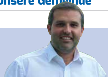
Ewald Bürger, Bürgermeister