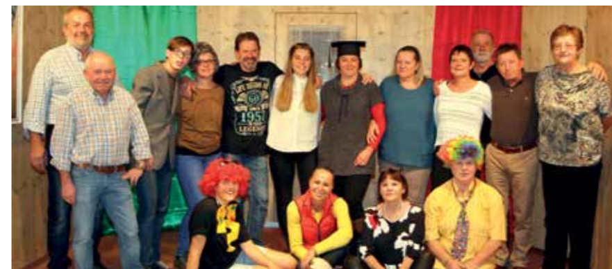
Die vollzählige Theatertruppe nach der gelungenen Premiere.

Ihr Bürgermeister Ewald Bürger, die ÖVP und SPÖ Mitglieder des Gemeinderates wünschen Ihnen ein frohes Weihnachtsfest und viel Erfolg und Gesundheit für 2018!