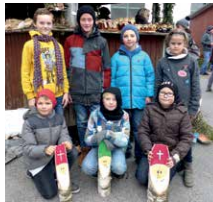
Die Ministranten bei ihrem Verkaufstand mit selbstgebastelten und selbstgemachten Waren.