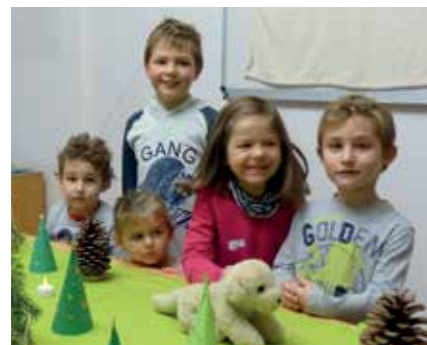
Die Kinder konnten im Gemeindeamt eine Märchenstunde besuchen.