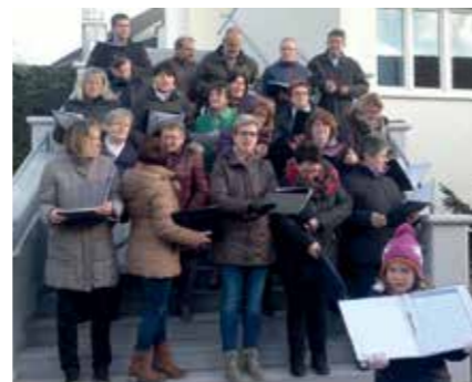
Der gemischte Chor Pilgersdorf eröffnete feierlich den Adventmarkt