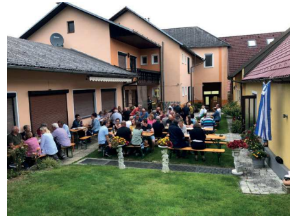
Die Spezialitätenabende im Sommer sind immer sehr gut besucht.