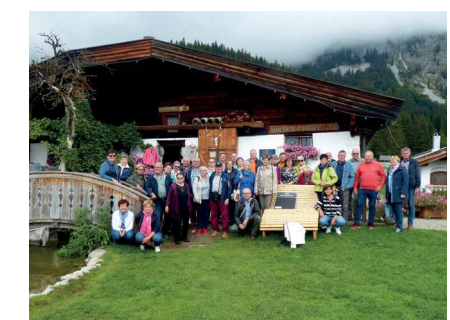
1, 2 oben: Gemeinsam wurde das wunderschöne Tirol erkundet. 3, 4, 5 unten: Der Tagesausflug im Oktober führte ins Südburgenland.