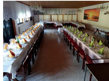
Im großen Saal können viele Gäste bewirtet werden.