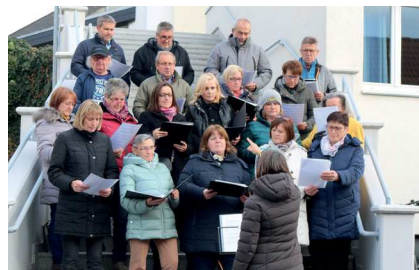
Der gemischte Chor Pilgersdorf eröffnete feierlich den Adventmarkt.