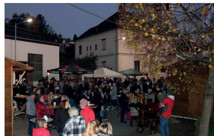
Viele Besucher genossen den Weihnachtsmarkt in Pilgersdorf.